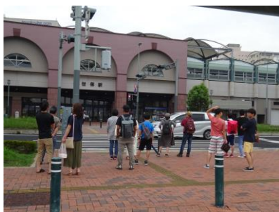
G地点(佐世保駅みなと口)

JR佐世保駅周辺の人の流れは、「させぼ五番街」開業後初調査(平成26年8月)の数値と比較すると、休日で(3地点合計)0.93倍、平日で(3地点合計)1.31倍となっている。