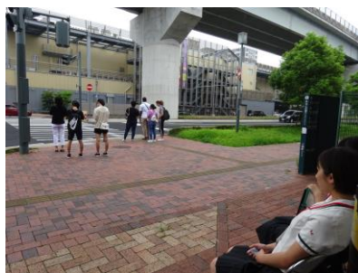
H地点(アルカス佐世保横)