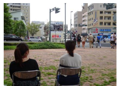
I地点(アルファビル横)