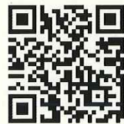
佐世保地方総監部 オープンカウンター

お問い合わせ窓口：佐世保地方総監部経理部契約課 電話番号：0956-23-7111（内線：3254） 受付時間：平日午前9時～午後16時